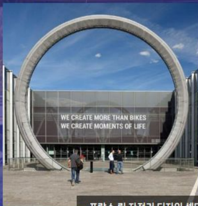
프랑스 릴 자전거 디자인 센터