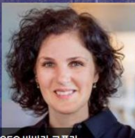
글로벌CEO 바바라 코플라