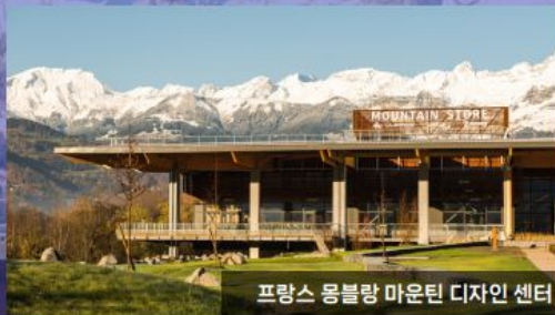
프랑스 몽블랑 마운틴 디자인 센터