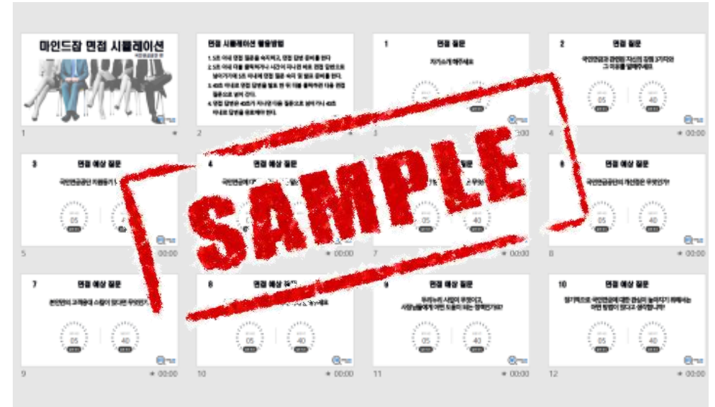
NCS 기반 모의면접 시뮬레이션 자료 제공