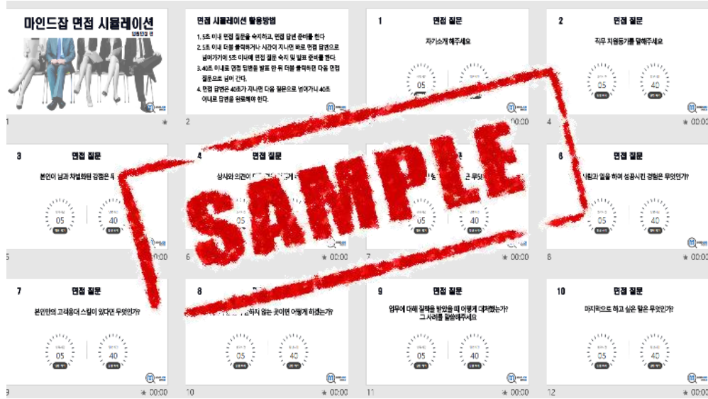
인성면접 기반 모의면접 시뮬레이션 자료 제공